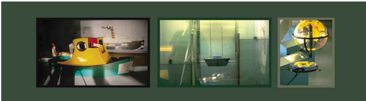
"Professor Plons", interactieve kindertentoonstelling over maritieme basis principes.

opstellingen geven je de gelegenheid om ontdekkingen te doen. Daarom beschrijven ze niet al te precies wat de ontdekking zou moeten zijn. Daar waar uitleg nodig is, is deze kort, simpel en zo duidelijk mogelijk.