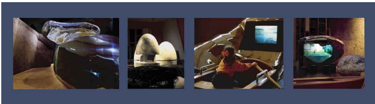
"Blumberger Mühle", Angermünde, Duitsland