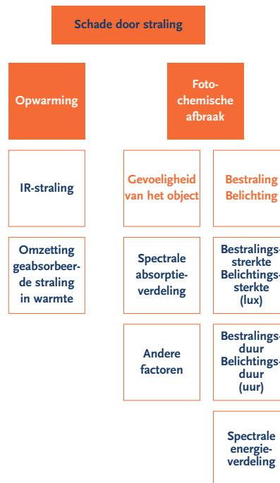
Figuur 5. Schematisch overzicht van schade door straling

Bestraling c.q. belichting De bestraling c.q. belichting hangt af van drie factoren: - de hoeveelheid energie die per tijdseenheid op het oppervlak valt; de bestralingssterkte of in het geval van licht de verlichtingssterkte (lx);