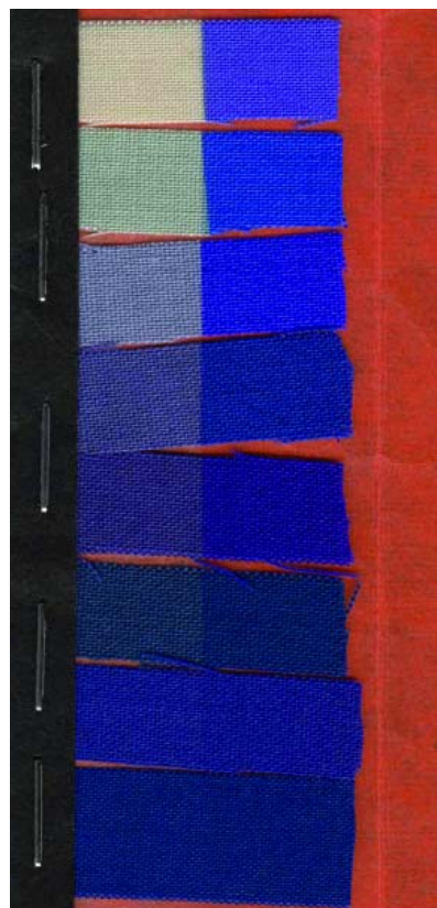
Figuur 7. ISO Blauwe wol standaard: acht stalen wol blootgesteld aan 120 Mlx.h (UV-rijk). Het kleurverschil tussen de belichte linker- en onbelichte rechterkant loopt van ISO 1 \Delta E = 45 (boven, 30 jwv: totaal verbleekt) via ISO 4 \Delta E = 15 (10 jwv) tot ISO 8 \Delta E = 1,5 (onder, 1 jwv).

De belichtingsdosis die nodig is om in ieder van de acht ISO blauwe wol standaarden een kleurverschil van \Delta E=1,5 (1 jwv) te veroorzaken, is bepaald en gepubliceerd (CIE, 2004). In de CIE-publicatie worden belichtingsdoses voor