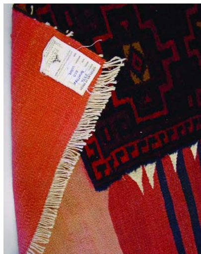
Figuur 1. Bij vergelijking van voor- en achterkant van het tapijt (20ste eeuw, Turkije) valt op hoezeer de oranje-rode strook (wol geveerd met de synthetische kleurstof Fast Red AV) verbleekt is onder invloed van licht en ultraviolette straling.