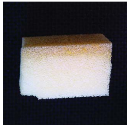
Figuur 3. Afbraak van polyurethaanschuim die zichtbaar wordt als vergeling. In de dwarsdoorsnede blijkt dat straling en zuurstof slechts in de bovenste 5 mm van het open-cel schuim doordringen en tot schade leiden.